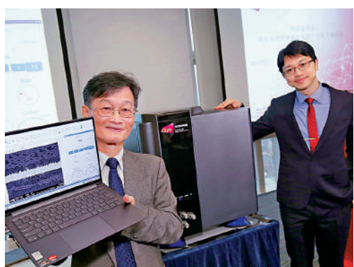
▲城市大學研發生產新一代電子顯微鏡。

【大公報訊】記者蘇薇報道：香港城市大學的研究團隊在深圳市福田區政府資助下，研發出先進技術自主設計及生產新一代電子顯微鏡，成為全球首間擁有相關科研實