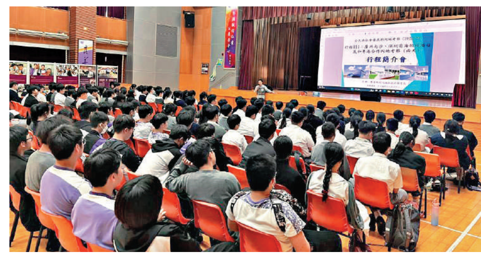
▲萬鈞伯裘書院老師向學生介紹內地考察團行程。

活動第一日下午，師生就會出發到廣州南沙，參觀粵港合作企業、科技創新企業，以及創意設計企業等，認識香港與內地的經濟及商業關係。而活動第二日，師生將前往明珠灣發展展覽中心及參觀一個景點，如下橫橋島鴉片戰爭遺蹟等；並參加有關南沙的發展機遇和粵港合作項目的專題講座。另外，每日活動結束後，老師亦會帶領學生鞏固與反思當天所學。