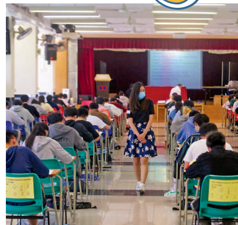
▲香港中學文憑試英文科筆試今日開考。資料圖片