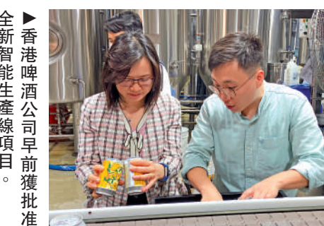
▲香港啤酒公司早前獲批准全智能生產線項目。

「再工業化資助計劃」資助生產商在港設立智能生產線，涉及生物科技、食品製造及加工、紡織及製衣、建造、印刷、醫療器材、納米纖維材料、衛星製造、電子、器材配件、健康產品和中藥等行業。