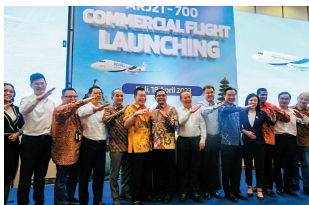
▲4月18日，ARJ21飛機在印尼峇里島舉行的首航儀式。

ARJ21飛機是中國商飛公司研製的中短程噴氣式支線客機，航程2225公里至3700公里。2022年12月18日，ARJ21正式交付首家海外客戶印尼翎亞航空公司。截至目前，ARJ21飛機已累計交付100餘架，安全運營超20萬飛行小時。