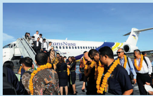
▲印尼翎亞航空ARJ21飛機首航旅客抵達峇里島時受到當地歡迎。 中新社