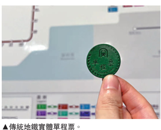
▲傳統地鐵實體單程票。

可隨時購票、隨時退票。需要留意的是，虛擬單程票的二維碼和已有的乘車碼有所不同。虛擬單程票採用的是先付費後乘車的模式，入站乘車時必須在購票選定的起始站進站，非起始站不能刷碼過閘進站，但在車資範圍內的任意站均可刷碼過站。