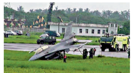
▲台空軍F16戰機在訓練時滑出跑道導致機頭損壞。

據報道，採購案分兩項，一項為標準航材零件二號訂單，金額為99億元新台幣，執行期間為今年4月至2028年3月，另一項是非標準航材零附件採購，金額是29.4億元新台幣，執行期間從今年4月開始，至2027年6月完成。這兩項合計128.4億元新台幣。此前，美媒於17日傳出美國將向台灣出售400枚岸基「魚叉」反艦導彈的消息，讓部分島內媒體如同打了興奮劑，甚至宣稱「它們可以摧毀一半的解放軍水面艦隊」。不過，有軍事專家表示，這種美軍淘汰的反艦導彈在性能上已經過時，如今只有台灣還在大力引進，顯然又成為「冤大頭」。在4月18日外交部的例行記者會上，外交部發言人汪文斌對此表示，台