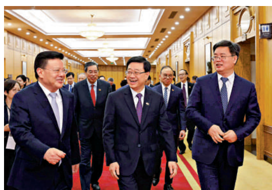
李家超率領訪問團昨日抵達深圳，與深圳市委書記孟凡利和市長卓偉中交流。

多位立法會議員表示，此次大灣區考察團是一個好的開始，不單體現行政和立法機關團結一致，真正做到良性互動，更將落實「愛國者治港」推至更高台階。香港要把握好機遇，港深兩地加強交流，香港各個界別都會找到屬於自己行業的機遇。