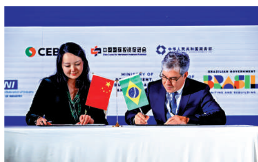
▲中國與巴西上月達成以本幣進行貿易結算的協議。

後，令俄國金融市場加速向中國靠攏，俄羅斯央行數據亦顯示，截至去年9月份，以人民幣支付的俄羅斯出口佔比升至14%，而中