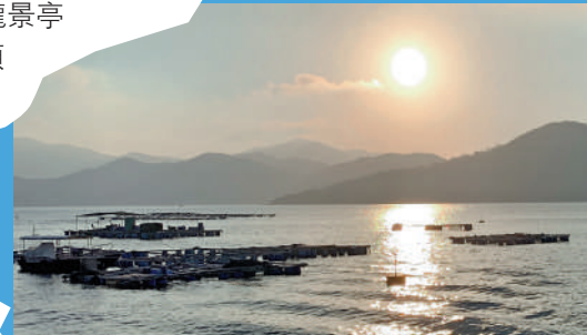
▼塔門的日落迷人。