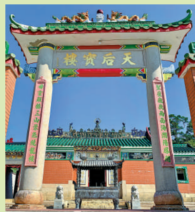
▲天后古廟歷史悠久。

天后古廟創建於清康熙年間，雖然經過雍正、乾隆、嘉慶、光緒等年間的多次修復，但仍保留傳統的原汁原味，被評為香港的二級歷史建築。