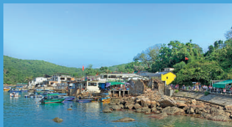
▲塔門保留着濃濃的漁鄉風情。