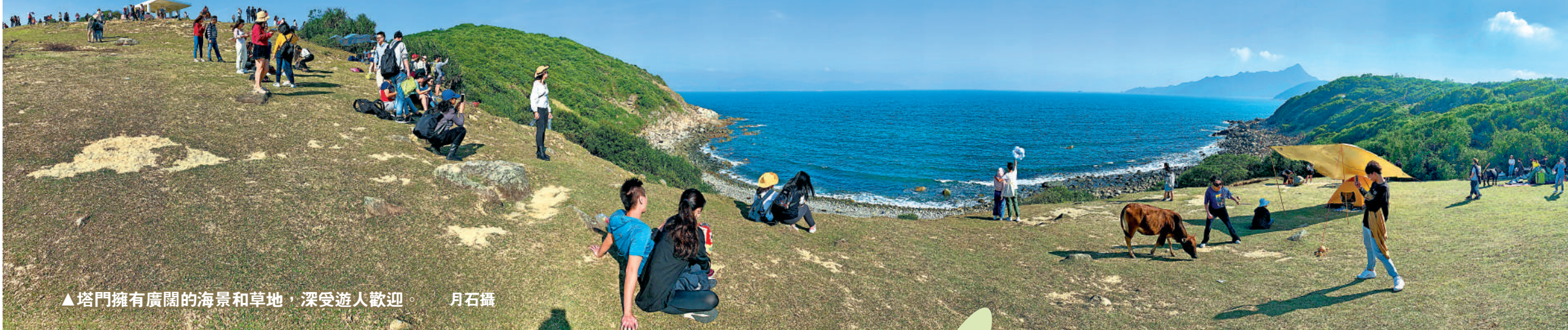
▲塔門擁有廣闊的海景和草地，深受遊人歡迎。