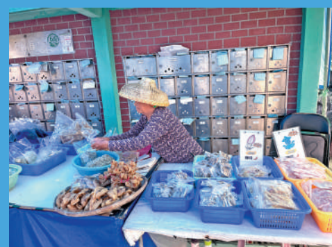
▲島上居民在街上擺小攤檔賣海味乾貨。