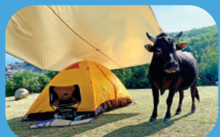
▲塔門的黃牛悠然自得。

從馬料水碼頭乘船出發，伴隨着輪船的轟鳴聲，看兩岸白鷺從海面飛過。船程有點長，但沿途風景宜人，時間倒是過得很快。到了塔門碼頭，首先看到的便是停靠在岸邊的漁船，所謂靠山吃山，靠海吃海，這裏的漁民靠捕魚為生。岸邊停靠着各式各樣的漁船，三三兩兩，十分整齊。這裏的房子像是還停留在七八十年代的樣子，碼頭邊的波波士多店旁邊有一個路牌指示，若是不想環島徒步，上島後可往左邊天后廟、疊石方向。如果是想要徒步，則向右轉，往榕樹村、漁民新村方向。