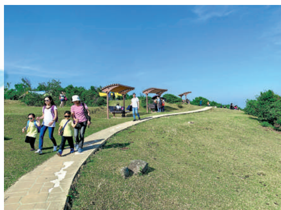
▲島上的步道平坦易行。

原本生活在此的牛沒有足夠的草吃，轉而吃被人棄置下來的膠袋和垃圾。一些牛的身形四肢已經很瘦削但離奇之大。動物專家認為是因為牠們吃了膠袋進肚裏沒法排出所致。網上有很多自願群組自發性去塔門撿垃圾，甚至有熱心市民從西貢買草然後運上山給塔門的牛吃。但這畢竟不是一個治本的好方法，郊遊時自己垃圾自己帶走，減少踐踏草地，愛護自然環境，人人有責。