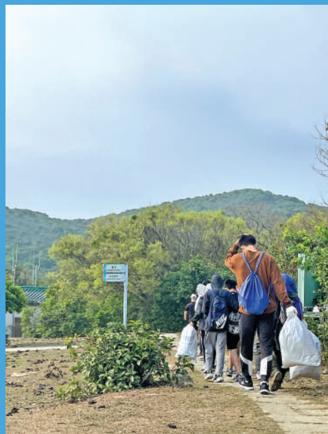
▲為減少牛群誤食遊人留下的垃圾，義工團體專門到塔門拾垃圾清潔。