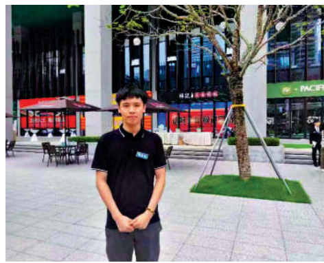
▲陳智安說，李家超認為夢工場的成功發展，令香港、前海及青年都成為贏家。

棟棟大樓，可見前海發展速度。前海不斷有新企業、新公司落成，包括「脫口秀」公司、劇本殺公司等。此外亦有綠色低碳、智能終端、元宇宙等新興企業。