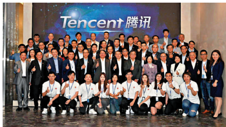
▲由政務司司長陳國基及創新科技及工業局局長孫東等帶隊的一組立法會大灣區訪問團，昨午抵達騰訊總部大樓，了解騰訊在智慧工業、互動娛樂、微信支付等方面的業務。