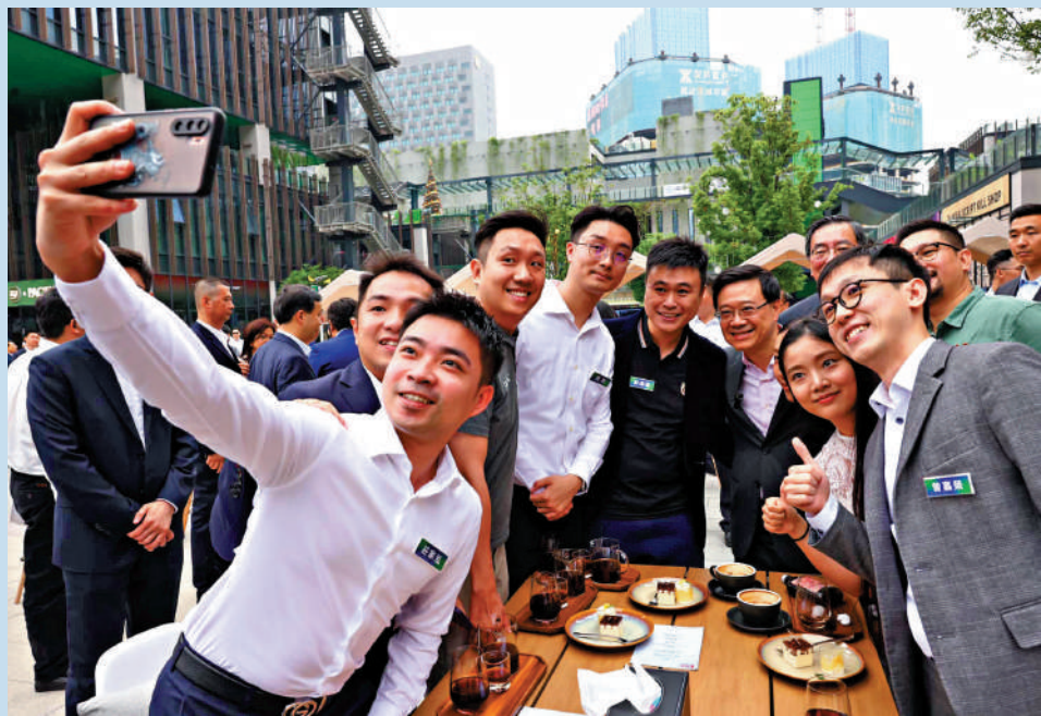
▲李家超與香港創業及就業青年交流，品嚐他們做的咖啡並一起合照。