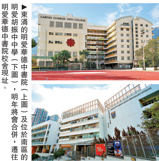
明愛華德中書院校舍現址（上圖）及位於南區的明愛胡振中中學（下圖），明年將會合併，遷往

話你知 政府統計處今年二月出版的《香港統計月刊》，本港生育率在過去30年呈下跌趨勢，由1991年每千名女性有1281名活產嬰兒，降至2021年的772名嬰兒，較1991年下跌近40%，創30年新低。新加坡下2021年有36953名嬰兒出生，較1991年人數下跌46%。統計處分析，2021年45歲的女性中，33%人仍未生育，比率高過2006年即15年前的22.5%。 女性初婚年齡中位數由1991年的26.2歲，升至2021年的30.6歲。遲婚會縮短女性生育時期。