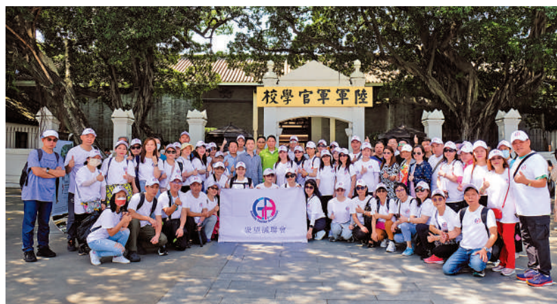
▲義工團體眾望誠聯會上週日舉行了「廣州考察一天團」，帶領逾80名港人到內地感受中國式發展及歷史、文化保育等。