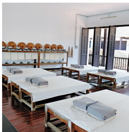
▲整間軍校只有百多個床位，部分學生要在校外搭帳篷。