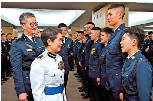
▲蕭澤頤和劉賜蕙出席香港警察學院的結業會操後，恭賀剛結業的見習督察。

蕭澤頤回應傳媒提問，指出2019年「黑暴」期間，很多遊行被騎劫引致火海處處，這些情況絕不能再發生，警方有責任確保公眾集會安全，提防有人別有用心企圖騎劫活動，未來遊行集會要有規範，採取掛牌等目的的是方便識別參與者，保障大眾安全。