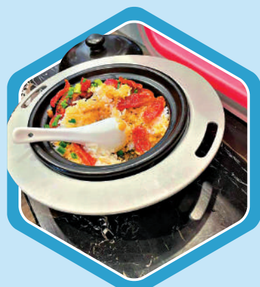
▲訪問團試食機器人煮的煲仔飯，大讚好味道。

廣東省還將加強省市聯動，支持廣州、深圳、佛山、東莞等地打造製造業數字化轉型示範城市。目前，廣東已累計推動2.25萬間規模以上工廠企業數字化轉型，到2025年，數目將倍增至超過5萬間。