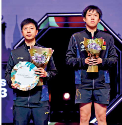
▲男單冠軍王楚欽（右）與亞軍馬龍（左）在頒獎台領獎。

拿單打冠軍，最寶貴是對自己帶來信心。」 壓軸上演的男單決賽，世界排名第2位的王楚欽面對馬龍，王楚欽在第一局連救3個「局點」，以12：10上演單局逆轉好戲。王楚欽第2局乘勢追擊以11：1再下一城。局數落後0：2的馬龍未能收復失地，最終王楚欽再贏兩局11：8、11：7獲勝，連續三年捧盃。王楚欽賽後說：「這場比賽並不能以順利來定義，還是第一局最重要，在8：10落後的情況下拿下了。」