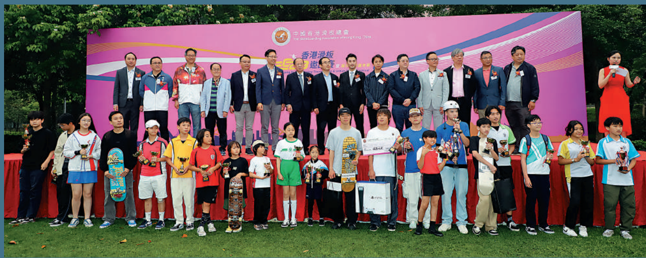
◀頒獎嘉賓與得獎者大合照。