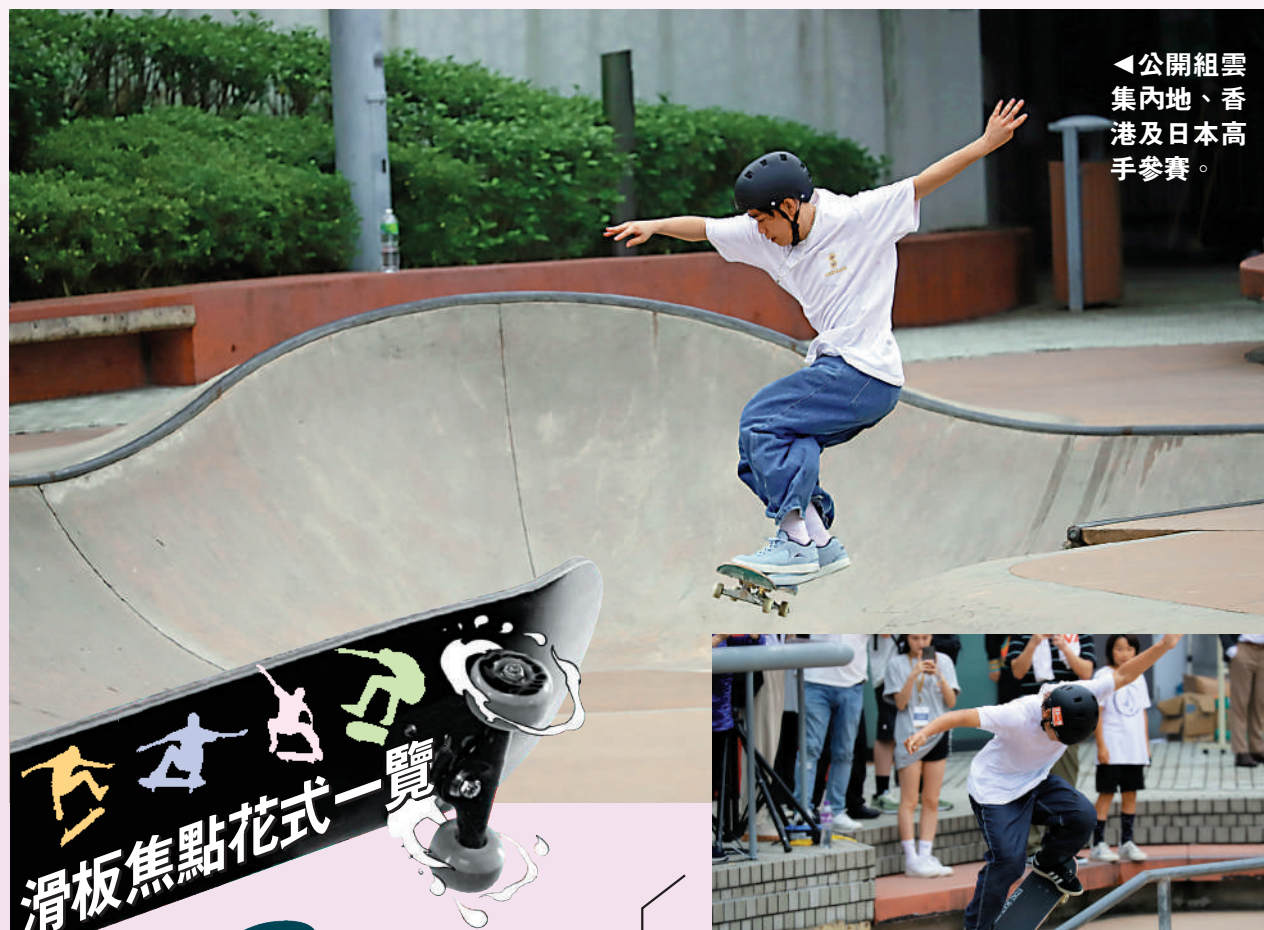
◀公開組雲集內地、香港及日本高手參賽。