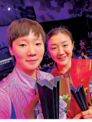
▲女單冠軍王曼昱（左）與陳夢（右）領獎後自拍合照。