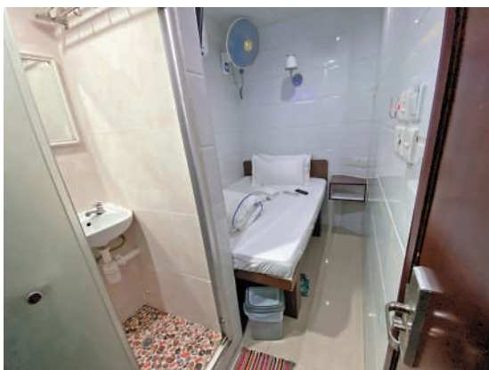
▲記者實地觀察重慶大廈內賓館環境，十分狹小，而且有陣陣異味。