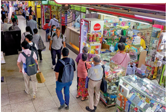
▲重慶大廈地下是商場，人流混雜，較為嘈吵。

坐落尖沙咀的重慶大廈，是由5棟17層連體式樓宇所組成的住商混合型大樓，匯聚了來自各國的商人、勞工和背包客，堪稱全球化小小縮影。該大廈原本是住宅單位，但現在成了平價酒店、商店等雲集的特別社區，別具特色。到此打卡沒問題，甚至住上一晚體驗一下也行，但如果想省錢、長住數日，就要好好考慮了。