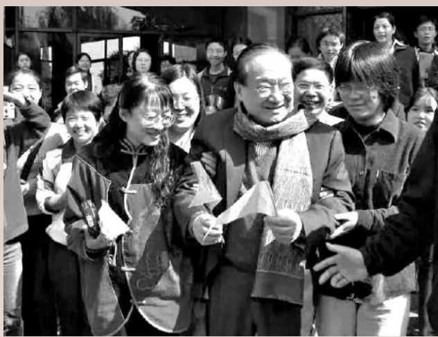
▲已故金庸先生昔日與嘉興學院學生親切交談，並深情寄語。