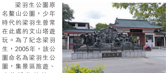
▲廣西蒙山縣梁羽生公園外，《七劍下天山》的雕像。

梁羽生公園原名鰲山公園，少年時代的梁羽生曾常在此處的文山塔遊玩。為了紀念梁羽生，2005年，該公園命名為梁羽生公園，集景區旅遊、武俠博物館於一體。景區大門有金庸題字，公園內設有思俠亭、天女亭、文筆塔等景點，記錄了梁羽生演繹「武俠」的生涯。