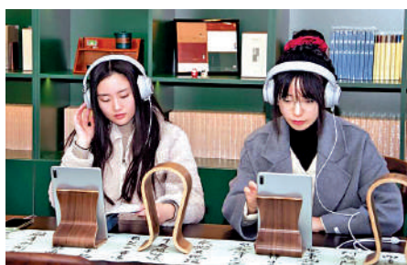
▲遊人在「鍾書客廳」聆聽鍾書經典文學作品片段。

2022年，無錫市推出「百宅百院」活化利用工程，擬用3年時間，完成100個故居舊址的活化利用項目。利用錢鍾書故居後兩進打造的「鍾書客廳」被列入首批活化利用項目之一。項目於今年1月4日正式對外開放，客廳劃分為5個主題空間，展示了錢鍾書先生的精神世界和錢氏家族的事跡風貌。