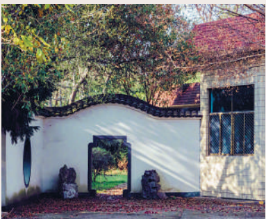
▲如今，金庸圖書館的院子裏積滿落葉。

搬遷拆的問題，自己曾經捐贈的一所希望小學就遇到過撤併的問題。「當時雖捐贈已經過去了十幾年，但當地政府還是聯繫到我來徵求意見，並詳細說明了拆除哪些建築，保留下來的建築也清楚設定了使用原則等。」因此他認為，不論原址拆或不拆，首先不能違背金庸先生的捐贈初心。如果能夠同時活化利用好原址，傳承金庸武俠小說文脈，對於金庸迷來說是一大幸事，對於嘉興城市發展來說也是更添底蘊。