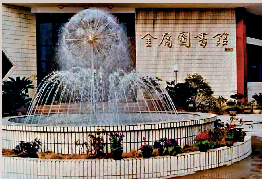
►金庸圖書館是內地唯一以「金庸」命名的圖書館。圖為當年圖書館正門。