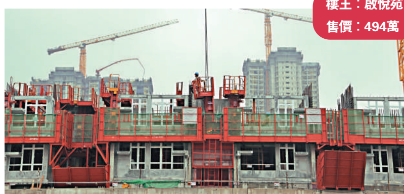
樓王：啟悅苑 售價：494萬元

消息指，新一期居屋最快於今年年中接受申請，第四季攞珠，預計明年首季揀樓，房委會預期今期居屋將會受申請者歡迎，對於或會有人質疑「居屋2023」的38%折扣率較去年的49%折扣率更低，房委會解釋主要是由於私人住宅物業整體價格下跌，以及「居屋2022」包括了位於市區優越位置的單位。