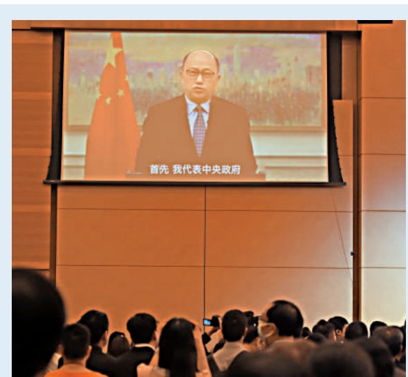
▲中聯辦主任鄭雁雄視像致辭表示，期待在新階段關鍵期，工聯會在香港由治及興新征程上，作出更大的貢獻。

【大公報訊】中聯辦主任鄭雁雄在工聯會成立75周年暨「服務市民走在前」系列行動啟動禮視像致辭表示，期待在新階段關鍵期，工聯會滿載75年的輝煌，奮楫揚帆再出發，在香港由治及興新征程上，作出更大的貢獻。