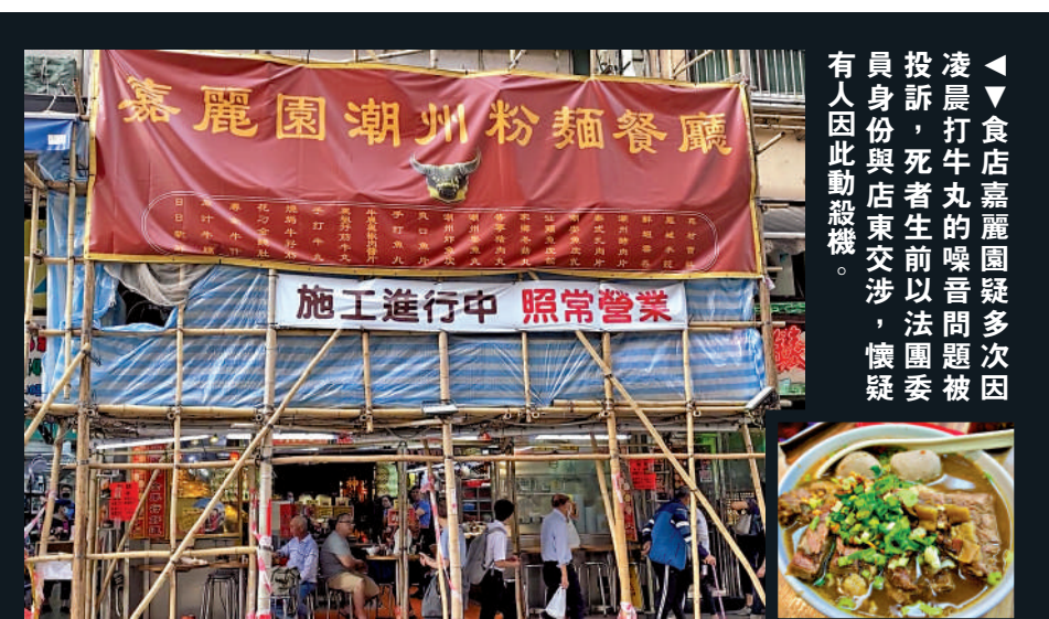
▲店嘉麗園潮州粉麵餐廳多次因凌晨打牛丸的噪音問題被投訴，死者生前以法團委員身份與店東交涉，懷疑有人因此動殺機。