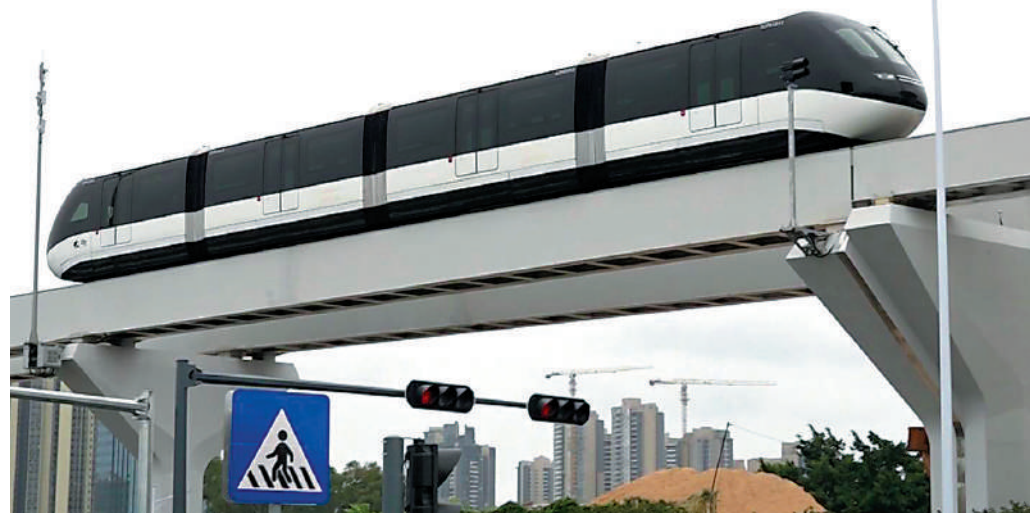
▲特區政府及議員大灣區訪問團早前在深圳試坐「雲巴」，議員對此技術好評如潮。

度。「雲巴」仍處於起步階段，當局會研究「雲巴」技術、營業、安全、操作等數據，探討在香港使用的可行性。