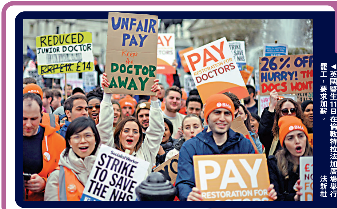
英國醫生11日在倫敦特拉法加廣場舉行罷工，要求加薪。

示，2022年第四季度每小時工作產出增幅與去年同期持平。每個工人和每個工作崗位的產出分別下降了0.2%和0.3%。