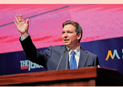
佛羅里達州州長德桑蒂斯27日在耶路撒冷會議上發言。

選民表示，因為德桑蒂斯與迪士尼的鬥爭而對他更為看好。但在所有黨派選民中，高達73%的選民稱不大可能支持一名因「政治或者文化立場不同」而懲罰企業的政治候選人。