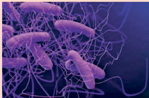
圖為「難辨梭菌」。

最近批准的2項療法，都是製藥業長年研究「微生物基因組」的成果，也就是存活在腸道的細菌、病毒和真菌群落。