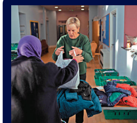
▲1月，英國考文垂市食物銀行的工作人員正在派發衣物。

幾乎每個年齡群體都動用儲蓄並削減開支。35歲以下的人群有四分之一向「父母」求助。報告還發現，近五分之一低收入家庭在過去3個月裏至少拖欠了一筆賬單，七分之一的人在過去1個月裏少吃或7天不吃飯。截至27日的過去4天內，約50萬人尋求食品銀行或取暖銀行救助。