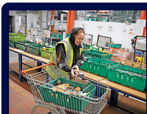
▲1月，英國考文垂市食物銀行的工作人員分發捐贈物品。

英國人健康倒退，已經拖累了英國經濟增長的速度。知名智庫公共政策研究所（IPPR）警告，2021年，長期病導致的收入損失達430億英鎊，佔到了英國GDP的2%。英國前首席醫療官、IPPR健康與繁榮委員會聯合主席莎莉·戴維斯教授說，「英國的人口健康狀況比