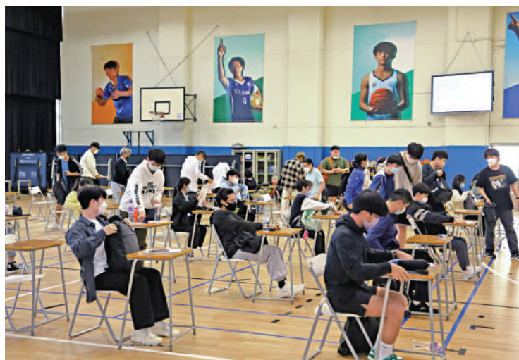
最後一屆通識科考試昨日舉行，明年起將由公民與社會發展科取代。