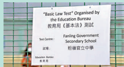
第五輪《基本法及香港國安法》測試今日開始接受報名，測試名額有限，先到先得。資料圖片

由二〇二三／二四學年起，所有公營學校、直接資助計劃學校及參加幼稚園教育計劃的幼稚園的新聘教師（包括新入職教師及轉校教師）均須在測試取得及格成績，方可獲考慮聘用。有關要求適用於教師職系的所有職級，包括校長。