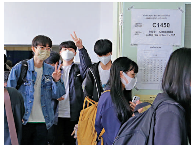
有考生昨日步出試場時，開心舉起V字手勢，看來對成績十分有信心。

今年通識科卷一資料回應題共設三道必答題，佔全科總分62%；卷二則為延伸回應題，考生須在三題中任選一題作答，佔總分38%。與去年一樣，今年兩卷均無政治化題目，考題內容都較為生活化。其中，卷一必答題設計內容包括「塑膠購物袋收費計劃」、長者及安老事務以及藥物專利。