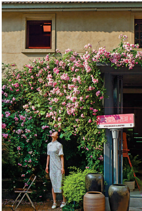
江蘇南京，年輕人在小西湖街區盛開的花兒前拍攝照片。暮春時節，當地城南街頭巷尾盛開的花卉攀上牆頭，與古色古香的建築相映成趣。