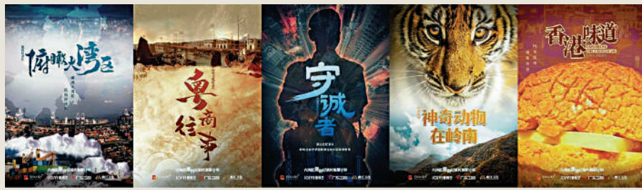
《促進大灣區原創紀錄片發展計劃》首批五個項目。 資料圖片

香港及澳門特區的電視頻道包括本地地面電視及衛星電視有二十四條頻道，香港地面有十四條、衛星有三條，澳門則地面約有六條及衛星一條。香港地面電視傳送形式是以大氣電波傳送，有別於珠三角的有線網絡的形式；香港鳳凰衛視三條頻道及澳門的澳亞衛視以衛星傳送。香港的無線翡翠台、鳳凰衛視其中一條頻道及澳門的澳亞衛視皆先後獲准進入廣東省有線網絡，向珠三角地區提供綜合娛樂內容服務。