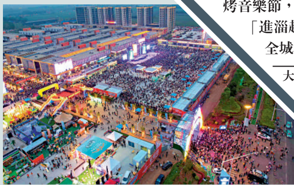
▲4月28日晚開幕的淄博燒烤節現場人山人海。

「這次真是說走就走的旅行，我倆都是美食愛好者，更是燒烤愛好者，全國燒烤吃了不少，唯獨沒吃過淄博燒烤。網上看到很多關於淄博燒烤的短視頻，我們也親自過來嘗嘗。」任女士的愛人趙先生表示，對於淄博的燒烤店，兩人並沒有仔細做攻略，兒子給他們買了兩張高鐵票就來了。