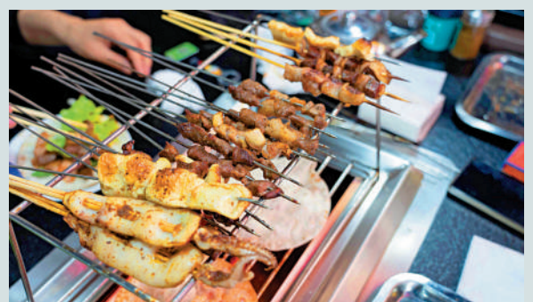
▲香氣四溢的燒烤已經成為了淄博的新名片。

據了解，為了迎接「五一」假期，淄博當地政府花費20天建成一座燒烤城，於4月28日起舉辦淄博燒烤音樂節，萬人同樂。名為「淄博燒烤海月龍宮體驗地」的戶外燒烤城佔地100多畝，緊鄰淄博最大的海鮮牛羊肉物流港，一根寫着淄博燒烤大字的「煙囪」佇立在會場門口，會場內部搭建了巨大的舞台用以音樂節演出，台下則是一個個餐桌，每桌都有炭烤爐供遊客使用。