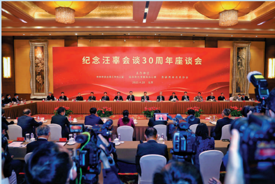
▲中共中央台辦、國務院台辦、海峽兩岸關係協會主辦的紀念汪辜會談30周年座談會28日在北京舉行。圖為座談會現場。

中共中央台辦、國務院台辦、海峽兩岸關係協會主辦的紀念汪辜會談30周年座談會4月28日在北京舉行。中共中央台辦、國務院台辦主任宋濤在座談會上指出，30年來的歷史啟示我們，「九二共識」是兩岸關係發展的政治基礎和台海和平穩定的定海神針。兩岸關係歷史反覆證明，堅持「九二共識」，贊成一個中國原則，兩岸關係就能改善發展，台灣同胞就能受益；否定「九二共識」，背離一個中國原則，兩岸關係就會緊張動盪，台灣同胞利益就會受損。