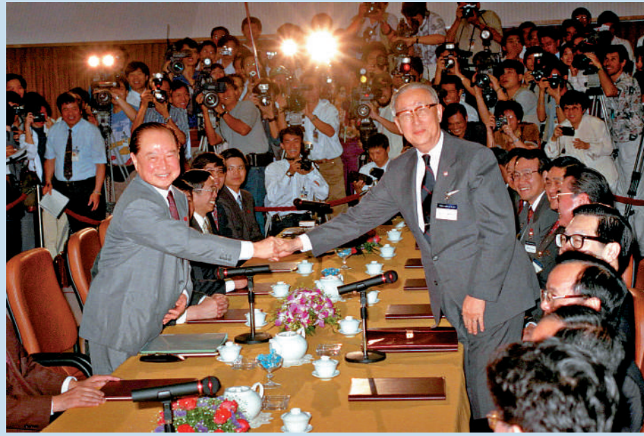
▲1993年4月27日「汪辜會談」在新加坡舉行。時任大陸海協會會長汪道涵（左）與時任台灣海基會董事長辜振甫在會談前握手。 資料圖片

30年前，在兩岸堅持體現一個中國原則的「九二共識」政治基礎上，海峽兩岸關係協會會長汪道涵與台灣海峽交流基金會董事長辜振甫在新加坡舉行會談，實現了兩岸雙方首次以受權民間團體名義舉行高層會談，標誌著兩岸關係發展邁出歷史性的重要一步。