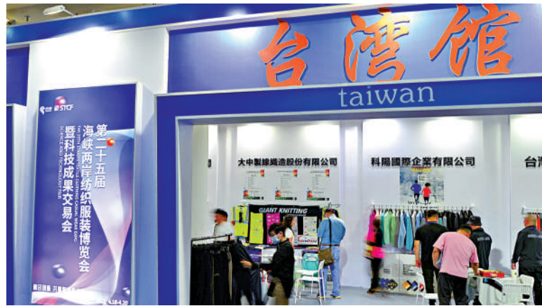
▲兩岸經密切。圖為福建海峽兩岸紡織服裝博覽會的台灣館展出時尚產品。