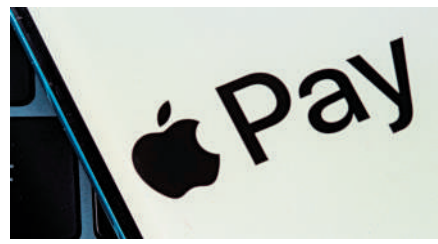
▲金管局要求銀行為客戶綁定信用卡至新流動支付工具時，增添多一重認證。

向銀行發布通函，提出幾項新措施，包括要求銀行為客戶綁定信用卡至新流動支付工具（例如Apple Pay）時，增添多一重認證，以及即時檢討有關超出信用限額信貸安排的做法。