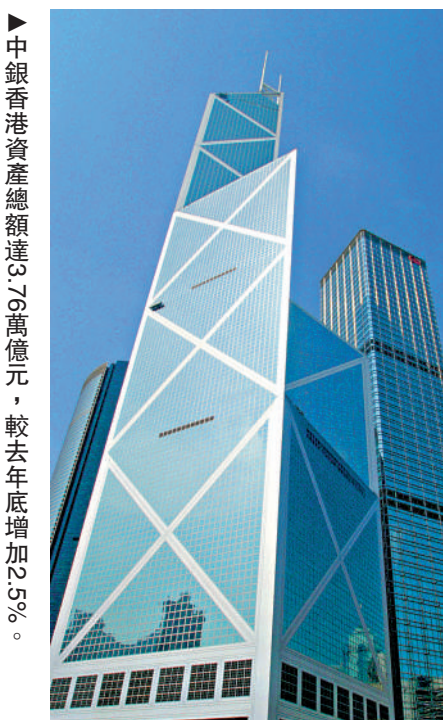
▲中銀香港資產總額達3.76萬億元，較去年底增加2.5%。

中銀香港表示，目前的經營環境依然複雜嚴峻，儘管環球金融市場波動加劇，本港金融系統有效運作，銀行體系保持穩健，相信全面通關有助提振消費氣氛。