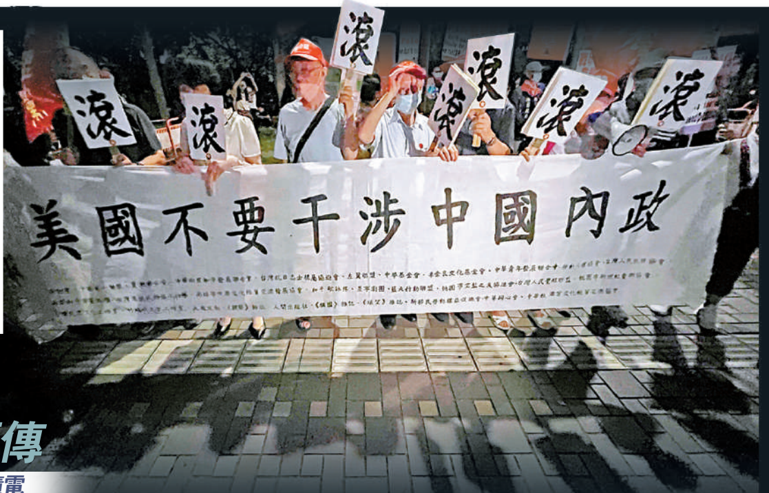
▲去年8月，美國眾議院議長佩洛西竄訪台灣，島內團體前往其下榻酒店外抗議。 資料圖片