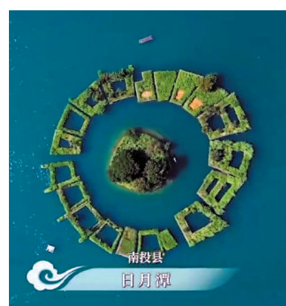
▲央視紀錄片《航拍中國》「台灣篇」視頻截圖。

角，以震撼的影像之美勾勒出寶島的山河壯麗、物華天寶，也用細膩的鏡頭語言呈現了兩岸同根共祖的文化傳統以及同胞血濃於水的情感勾連。無論是屏東縣持續了三百餘年的燒王船的傳統，還是龍山寺裏擺放着來自海峽兩岸各地的家鄉神像；無論是大甲鎮瀾宮的媽祖巡遊祭典的重大活動，還是四四南村的水泥平房，它們不僅僅是背井離鄉的人們寄託鄉愁、祈福許願的美好象徵，更見證着海峽之間永不分割的血脈親情。