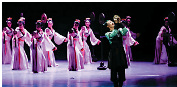
《花木蘭》是中央歌劇院的舞劇精品。