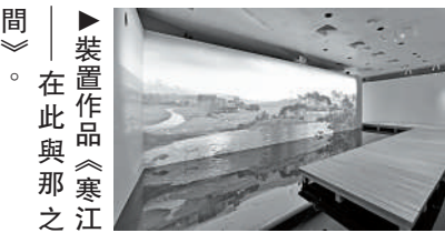
▶裝置作品《寒江》在此與那之間。

民族情——《射鹿圖卷》 這一主題則抒發了古人的愛國之情，明末畫家張穆所繪製的《射鹿圖卷》，將每一匹馬的姿態、身形都繪製得栩栩如生。作為能文能武的畫家，張穆曾募兵抗清，失敗後則歸隱故鄉，潛心繪畫。