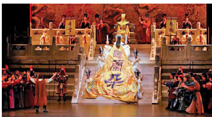
《圖蘭朵》是這次訪港三場演出的「返場」(Encore)劇目。