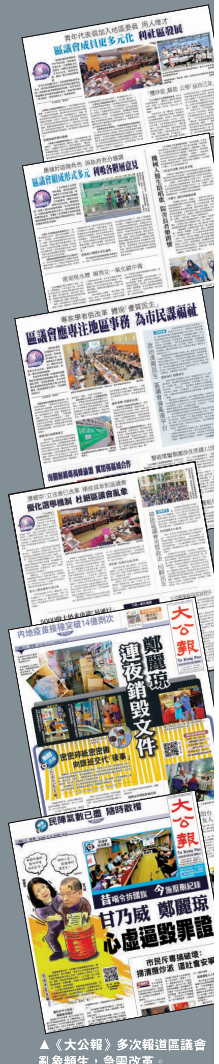
▲《大公報》多次報道區議會亂象頻生，急需改革。

●2020年5月12日，元朗區議會攬炒派議員打着所謂「止警誑」的標語，向與會的時任警務處處長鄧炳強「問罪」，又以有少女自稱在荃灣警署被「輪姦受孕」一事抹黑警隊，在鄧炳強當時披露最新案情後，自知理虧的攬炒派隨即惱羞成怒，以粗口辱罵鄧炳強，最後竟通過所謂「臨時動議」，「驅逐」鄧炳強離開會議廳。