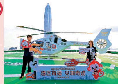
▲大中華國際交易廣場頂樓的停機坪。 大公報記者郭若溪攝

特色： 擁有國內首個A類高架直升機場，使用的是5座空客135直升機。航線途經深圳福田CBD、平安國際金融中心、市民中心、蓮花山公園、華強北片區各種地標性建築與景點。 交通： 搭乘高鐵至福田站，沿福華一路步行10分鐘即可到達。 大公報記者石華