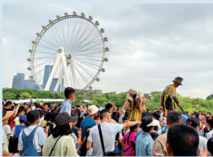
▲歡樂港灣遊客如織。

特色： 在歡樂港灣，此處正迎來「第二屆灣區國際戲劇生活節」，穿着各式各樣國際服裝的演職人員們，正以熱情飽滿的姿態巡遊，在旅客面前展現別樣風采，同時指引着旅客們有序遊玩。不少行人紛紛拿出手機拍照，並和他們握手。 交通： 搭乘高鐵至深圳北站，轉乘地鐵5號線直達臨海站，步行100米抵達。 大公報記者郭若溪