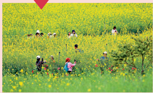
▲遊客徜徉在歡樂田園的花海。

交通： 搭乘高鐵到光明城站後轉乘M525路到碧眼村口站下車，換乘M411路到光明小鎮歡樂田園站。