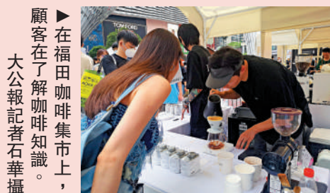
▶在福田咖啡集市上，顧客在了解咖啡知識。

推薦人： 港人胡女士 地點： 深圳市福田區福華一路深圳卓悅中心 推薦理由： 4月30日中午，港人胡女士一家就利用假期，專程北上打卡福田咖啡集市，她稱，福田站距離市中心最近，卓悅中心舉辦的戶外咖啡市集有超180家咖啡品牌亮相，覆蓋精品咖啡品牌、連鎖咖啡品牌和小眾社區咖啡品牌等多樣咖啡業態，規模很大，帶孩子體驗的同時也能學到不少咖啡知識，一日遊很不錯，「慢行+漫遊很適合我們，不用專門去擠景點。」胡女士說。