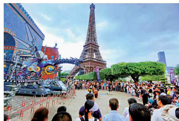
▲世界之窗在「五一」假期期間「WoW潮音嘉年華」音樂節活動，吸引萬人參加。

伴着節拍、踩着舞步登上巡遊舞台，與遊客歡樂互動。在世界之窗艾菲爾鐵塔下，「WoW潮音嘉年華」音樂節帶來潮流人氣樂隊、電音派對，掀起狂歡高潮。更讓遊客驚喜的是還有「無人機送貨入園」，該航線是國內首條無人機常態化景區航線，在深圳世界之窗與美國無人機合作下，給遊客帶來耳目一新的高科技點餐體驗。 大公報記者毛麗娟