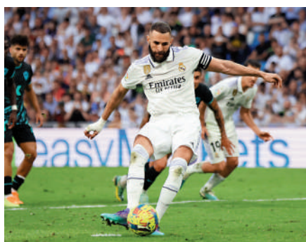
▲皇馬的賓施馬大演帽子戲法。

是被對方門將救出。」 皇馬就憑賓施馬上半場大演「帽子戲法」，下半場洛迪高斯又建一功，主場輕取艾美利亞4:2。賓施馬在4月已上演3次帽戲，今季西甲累積入17球，只較羅拔少2球，有力後來居上。