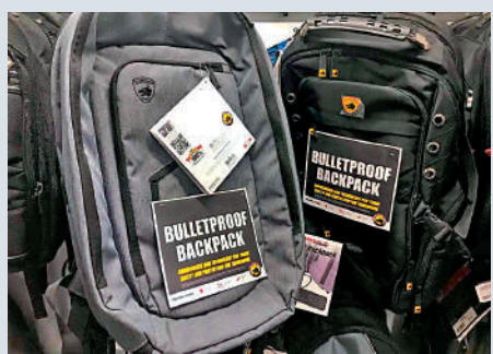
▲售價高達400美元的防彈背包。

事實上，保守勢力強大的得州是美國槍支管理最寬鬆的州之一，只要繳交低廉的槍牌費用，接受培訓和線上安全課程就能合法擁有槍支，早於2015年已批准州民無照攜帶步槍。2021年，得州州長阿博特簽令再放寬槍管要求，允許所有21歲或以上民眾無需申請，就可手持槍外出。