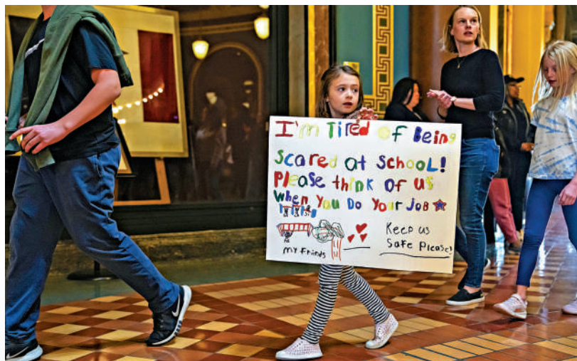
▲愛荷華州的小學生在州議會大廈舉標語示威，要求收緊槍支管控。

【大公報訊】綜合霍士新聞、《紐約郵報》報道：美國校園槍擊案頻發，但部分反對控槍的地區，無視槍支氾濫的根本問題，反而提出一些荒謬的要求。得州德索托獨立學區（Desoto）日前實施新措施，禁止中學生在本學年的剩餘時間裏背書包上學，只能攜帶筆盒或小型手提包進入學校，以防有人攜帶槍支。這項舉措被批治標不治本，有家長指出，根本措施應該是加強槍支管控。