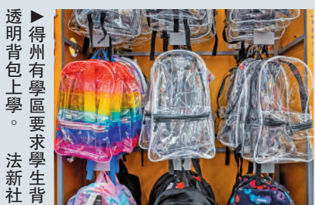
▶得州有學區要求學生背透明書包上學。