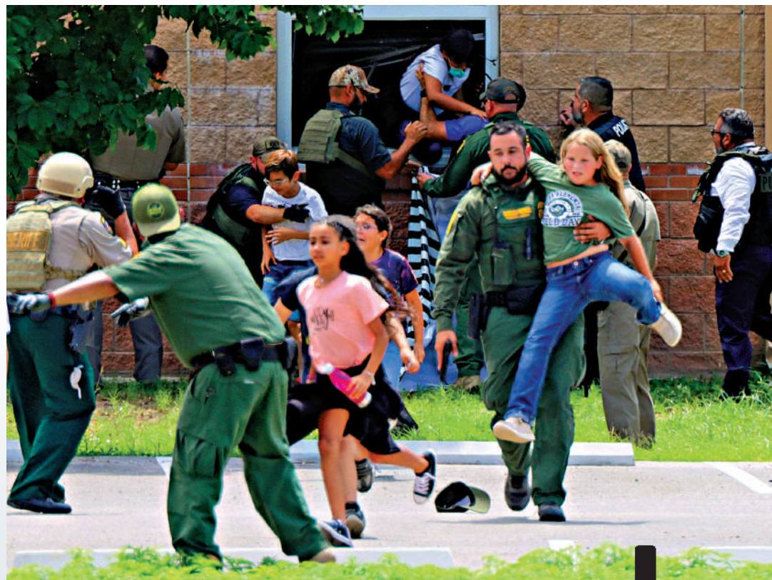
▶得州尤瓦爾迪市羅布小學去年5月發生槍擊案，學生們通過窗戶驚慌逃離。