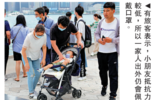
有旅客表示，小朋友抵抗力較低，所以一家人出外仍會佩戴口罩。