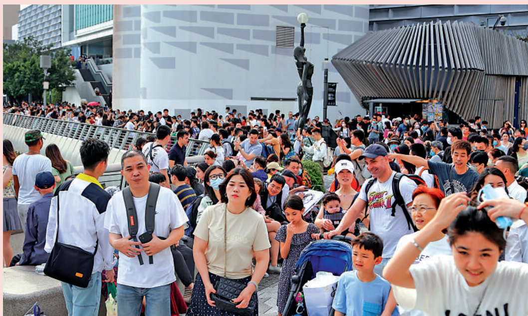
內地五一黃金周長假期，大批旅客訪港，尖沙咀星光大道人頭湧湧，水洩不通。