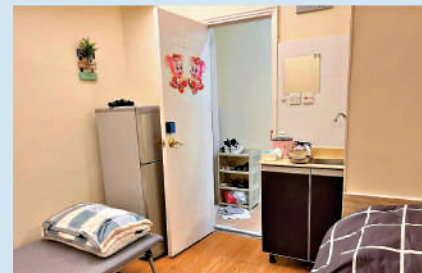
▲內地社交平台「小紅書」近期湧現不少香港民宿推介，但大公報記者調查發現，所謂的民宿，其實是由唐樓單位改裝的無牌賓館劊房。