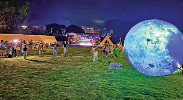
西涌力高樂園的觀星活動吸引眾多市民遊客。

萬平方米，於2010年9月建成啟用，建有天文圓頂、天文樓、綜合樓、氣象樓、觀測場以及科普廳等，是以光學天文觀測研究、地基太陽表面活動及高分辨率光譜觀測研究、空間天氣觀測研究、海洋氣象和生態環境氣象觀測研究等綜合性觀測為一體的觀測研究基地。