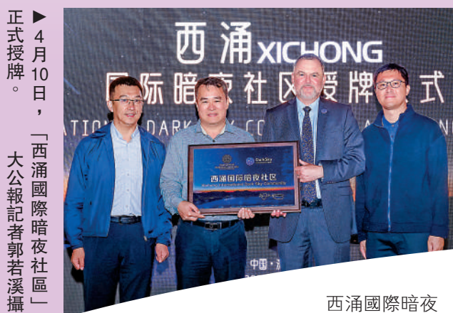
正式授牌。4月10日，「西涌國際暗夜社區」授牌儀式在該區舉行。圖為西涌國際暗夜社區授牌儀式。