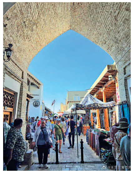
▲來自世界各地的遊客漫步烏茲別克斯坦歷史名城布哈拉。