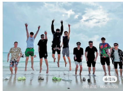
▲五一假期期間，一群中國遊客在泰國某海灘上合影留念。