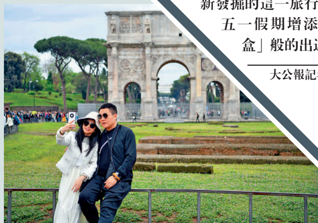
▲5月1日，中國遊客在意大利羅馬君士坦丁凱旋門附近自拍。

「98年，女生，坐標浙江，目的地東南亞，尋同伴」；「4·29-5·3想約一起同行，去哪裏都可以」；「斯里蘭卡，4·28上海出發，已組5人繼續尋人（旅伴），需共同做攻略」……五一長假前，內地各大網絡社交媒體上諸如此類「征旅伴」五一結伴出遊的帖文層出不窮，不少年輕人紛紛在帖文下方互動，並交換聯絡方式。