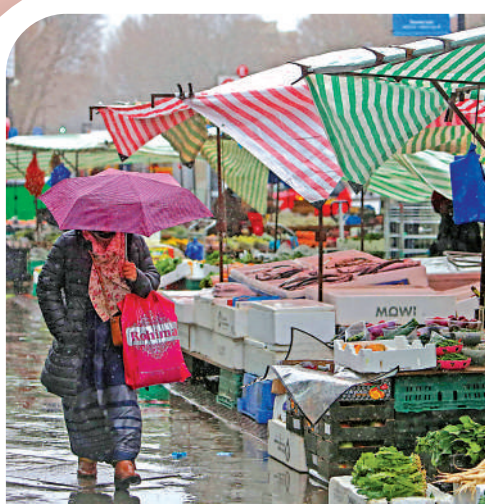
▲ 英國民眾深陷生活成本危機，圖為倫敦東部街市。

FDIC指，沒有保險覆蓋的美國銀行存款金額近年迅速增長，自2009年以來增長兩倍，達到7.7萬億美元，這類存款高度集中，增加了銀行擠兌風險。數據顯示，美國資產達570億美元的銀行之中，40%銀行的無保險覆蓋存款佔總存款比例超過一半。