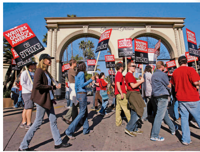
▲ 美國編劇2007年的大罷工造成21億美元經濟損失。

外界預計，如果罷工持續，影視行業內將會有兩萬人受到影響，涉及600個製作項目，南加州和紐約市受到的經濟影響較大。即日撰寫劇本的深夜脫口秀節目首當其衝。如果罷工持續，美國電視台將播出更多無劇本的真人騷、新聞和重播節目，原定在秋季上檔的劇集也可能推遲播出。但串流平台Netflix等受到的影響可能較電視台要少，因為可以購買舊劇集，或者播放美國以外的地區所製作的內容。