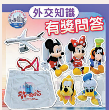
▲外交部公署在FB舉行外交知識有獎問答活動，市民踴躍參與。

半日，已經有數百位市民在留言區回答問題參賽，當中不乏精彩的論述。提醒大家，除了正確回答問題外，參加者還要讚好「中華人民共和國駐香港特別行政區特派員公署」Facebook專頁及帖文，否則就不符合參賽資格。