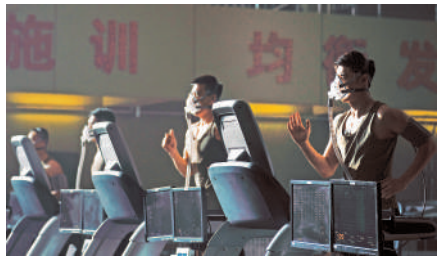
▲要正式成為試飛員，須經一連串嚴苛選拔。