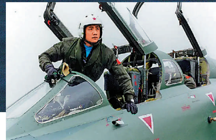
▲張挺為了避免平民傷亡，犧牲自己。