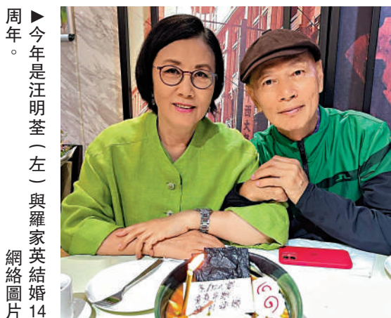
▶今年5月2日是汪明荃（左）與羅家英結婚14周年。

終於在今年二人結婚14周年，家英哥兌現當年承諾，特意在網上尋回同款同型號的戒指，還刻上兩人的名字，相當有心思。視頻中，阿姐甜笑地說：「好感動，好感動呀。」家英哥與阿姐更即席在鏡頭前隔空接吻。圈中好友李司棋、胡定欣等都留言大讚兩人好sweet。