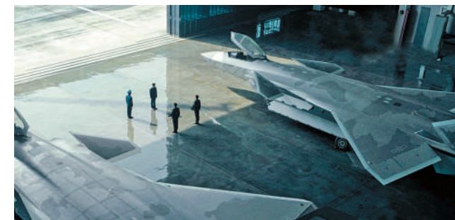
▲電影《長空之王》以中國空軍的強軍之路為背景。

《長空之王》以精良製作完成天空飛行的視覺效果，亦以挖掘人物內心成長，建構了具有感染力的主旋律敘事，帶出守護主權、保護人民的壯志雄心。電影表現了中國空軍科技強軍、鑄劍天空的艱辛發展之路，也展現了中國空軍保家衛國的俠義風範與崇高精神。