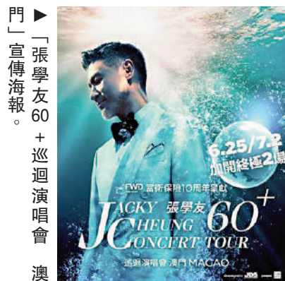
▶「張學友60+巡迴演唱會」宣傳海報。