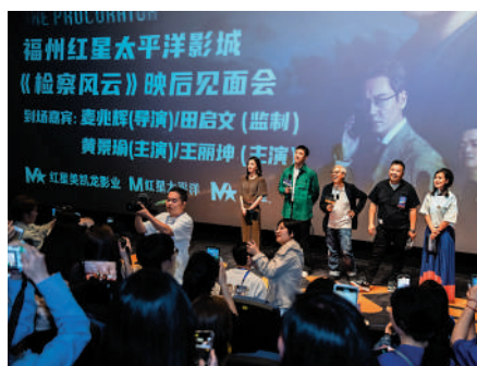
▲電影《檢察風雲》劇組在福州與影迷互動。

據燈塔專業版數據，截至5月3日21時，2023年內地「五一檔」（4月29日至5月3日）粗報票房15.11億元人民幣，票房前五位的電影依次為《人生路不熟》《長空之王》《這些年，我們》《灌籃高手》《檢察風雲》。《檢察風雲》導演麥兆輝，監製田啟文，領銜主演黃景瑜、王麗坤早前現身福州，圍繞電影台前幕後與現場影迷展開零距離互動。