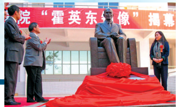
▲霍英東熱心支持教育，曾捐資興建韶關學院英東生物工程學院。圖為霍氏家族代表為廣東韶關學院的霍英東銅像揭幕。

▼霍英東為廣州南沙的開發建設嘔心瀝血10多年。圖為2004年霍英東（左三）出席廣州南沙香港中華總商會大廈封頂儀式。