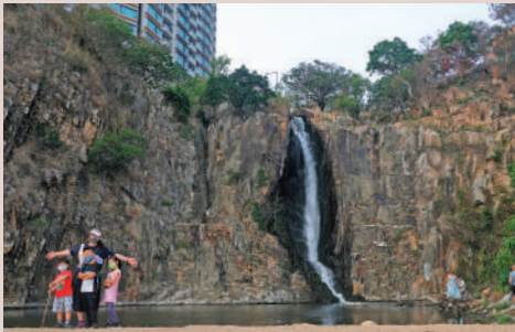
▲華富邨瀑布公園因被貝沙灣包圍，有「扶林飛瀑」的美譽。

往數碼港的方向走，可以到達香港有名的公共屋邨華富邨。在這裏藏着一個獨特的自然景觀，名為華富邨瀑布公園。因被貝沙灣包圍，有「扶林飛瀑」的美譽。沿瀑布灣公園右邊梯級往下走，便到達瀑布灣。在瀑布灣的石灘上，可以遠眺南丫島及博寮海峽。