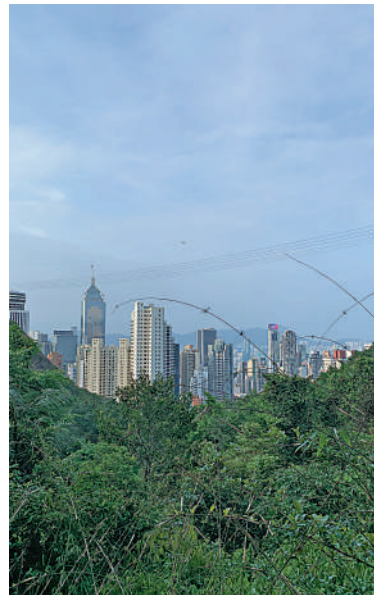
▲從灣仔峽道往山上走，可以看到灣仔一帶的高樓大廈。

香港仔水塘分為上水塘和下水塘兩個區域，香港仔自然教育徑從中穿過。沿路可以完整看到