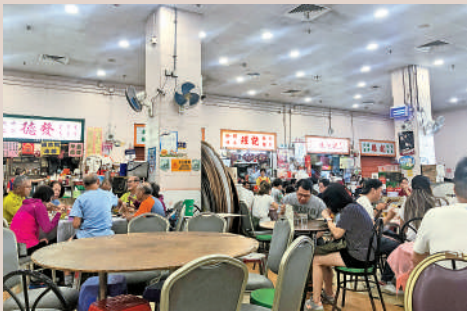
▲位於鴨脷洲的耀記頗有名氣。

鴨脷洲街市內，有不少漁民經營的美食小店。藏在街市內的小店更是卧虎藏龍，耀記咖啡內的海鮮即買即食、味道鮮美；經典港式美食一口西多士、炸三寶和魚蛋牛腩麵則是陳新記的招牌。若是想吃碗仔翅，可以前往食記餐廳品嚐用料豐富，口感滑嫩的「生菜魚肉」，其他經典小食炸魚蛋、炸燒賣亦是不錯的選擇。不少本地居民也會光顧於此，盡顯港式的原汁原味。