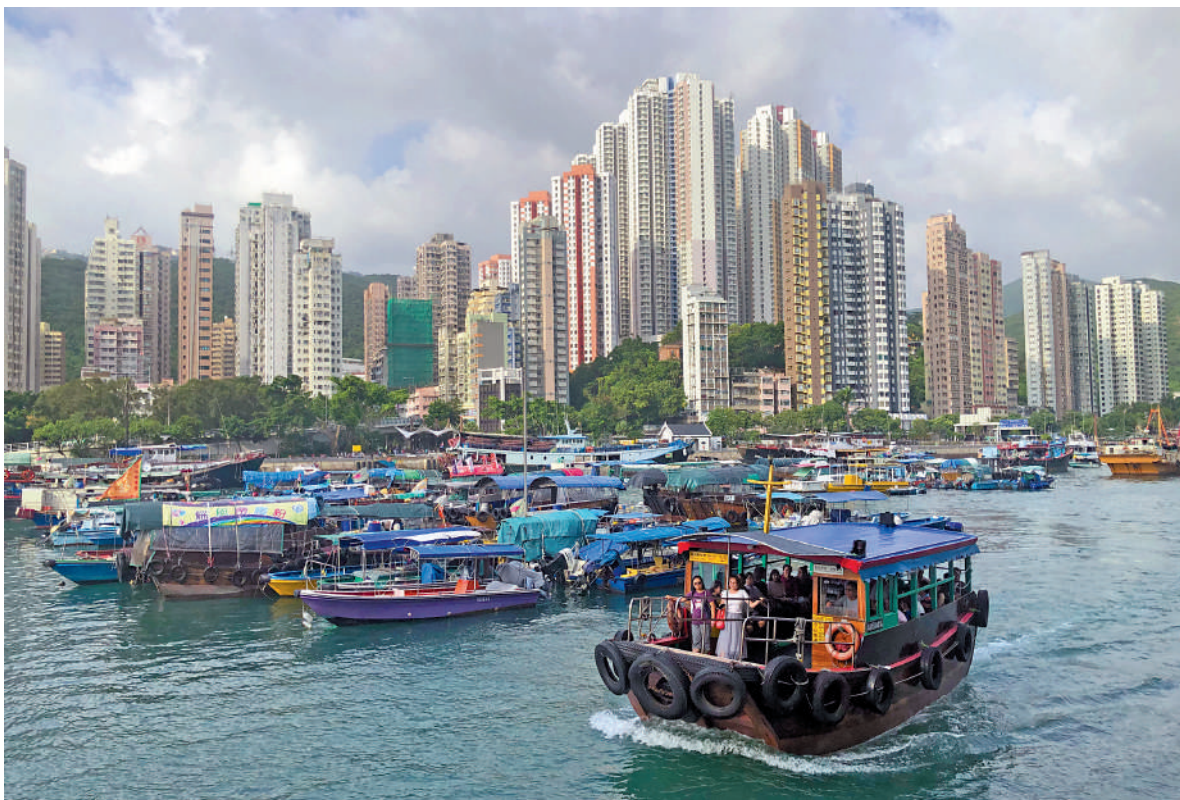
▲搭乘香港仔避風塘街渡，感受水上人家生活。

比起港島中西區的繁華，南區更有傳統漁港的風情。從灣仔的藍屋上山，走過灣仔峽道、經過寶雲道、司徒拔道後，來到灣仔峽公園，便可以看到香港仔郊野公園的路牌，和通往香港南區一帶的香港仔水塘道。