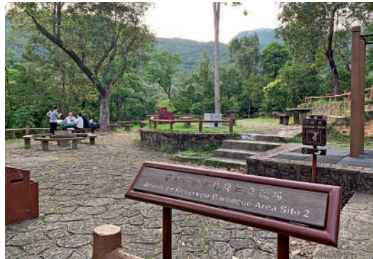
▲香港仔郊野公園內有不少燒烤場供遊客休憩。