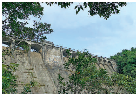
▲香港仔水塘的水壩被列為法定古蹟。

無論是散步、鍛煉，還是單純地欣賞山間的風景，在這裏都可以度過一段充實的下午時光。沿着指示牌上往香港仔的方向下山，走出香港仔郊野公園後，視野能直接看到山下的風景。路過半山腰的學校，便可以到達漁光街乘坐小巴。若是想要再往下走走，夜幕降臨時，剛好可以看到山腳下的熟食店、水果店燈火點亮。街上熙熙攘攘，獨有一份漁港城市的熱鬧。