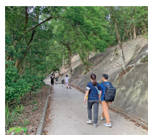
▲一家大小沿香港仔健身徑踏青。