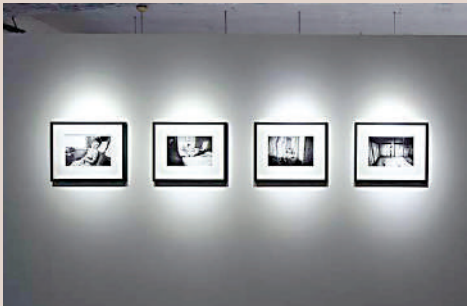
▲刺點畫廊是香港最大的藝廊空間之一。