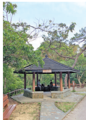
▲爬山途中可在松鶴亭稍作休息。