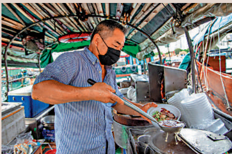
▲香港仔以艇仔粉而出名。