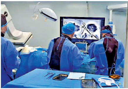
▲介入式腦機接口非人靈長類動物試驗手術實景。

「腦機接口技術可以將腦電信號轉換為控制指令，從而幫助運動功能障礙患者（如：腦卒中、漸凍症等）與外部設備交互，提升生活質量。在該技術研究過程中發現，侵入式腦機接口創傷大，例如美國馬斯克的Neuralink公司侵入式腦機接口試驗猴已有多只死亡；非侵入式腦機接口易受大腦容積導體效應的影響，腦電信號長期穩定性差。」段峰表示，本次試驗對推動腦科學領域研究具有重要意義，標誌着我國腦機接口技術躋身國際領先行列。