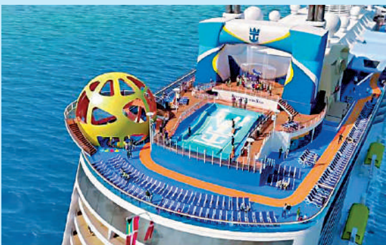
▲皇家加勒比「海洋光譜號」郵輪。