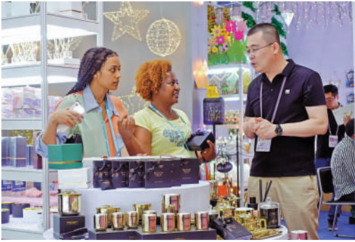
▲第133屆廣交會線下展在廣州圓滿落幕。

【大公報訊】記者盧靜怡廣州報道：5日，第133屆廣交會線下展在廣州圓滿落幕。本屆廣交會總展覽面積達150萬平方米，線下參展企業數量達3.5萬家，規模史上最大。根據廣交會官方統計，累計進館超290萬人次，創歷史新高。其中，線下參展的境外採購商達到12.9萬人，來自213個國家和地區。當中「一帶一路」沿線國家採購商超過6萬人，佔比近50%。本屆廣交會丁財兩旺，現場出口成交216.9億美元，恢復至疫情前2019年春季廣交會的約73%。在境外採購商數量方面，恢復至2019年同期展會的66%。不少企業表示，已有大量客戶預約實地看