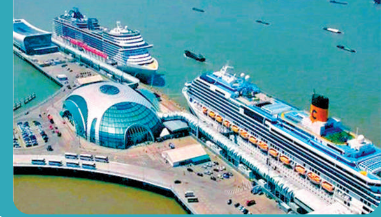
▲上海吳淞口國際郵輪港。

李飛透露，截至目前，中國同中東歐國家雙向投資規模已接近200億美元。今年一季度，中國對中東歐國家全行業直接投資同比大幅增長148%，中國企業赴中東歐地區投資意願強烈。投資領域涉及汽車零部件、家電、醫藥、物流、能源、礦產等。