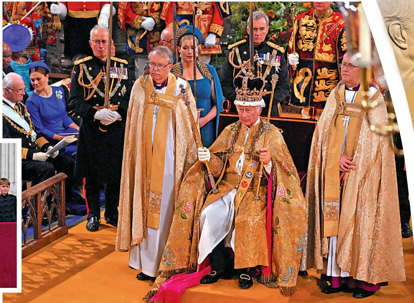
▲查爾斯三世戴上聖愛德華王冠，完成加冕。

【大公報訊】綜合《衛報》、CNN報道：當地時間5月6日，英國國王查爾斯三世的加冕儀式在倫敦西敏寺舉行。這是英國王室70年來首次舉辦加冕典禮，比起女王伊麗莎白二世1953年的加冕禮，時間更短，參與人數也從8000多人縮減到2000多人。不過，加冕禮和13天慶祝活動至少花費2.5億英鎊（約25億港元），全由納稅人埋單，引發爭議。當日數千名抗議人士高舉「不是我的國王」牌子在倫敦市中心聚集，似乎顯示英國君主制未來面臨重重挑戰。