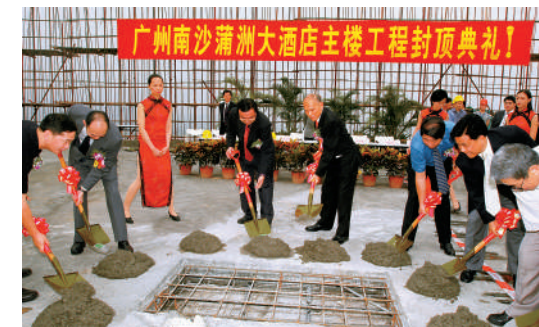
▲霍英東與嘉賓們，在2002年9月底主持南沙蒲洲大酒店封頂儀式，整個投資項目超過四億元人民幣。

「最是夢繫家國，鄉土豈可遺忘？長江黃河富饒大地，五千年文化源遠流長；中華有過光輝歲月，也曾經歷苦難創傷。道路從來是迂迴曲折，是非榮辱使人明確方向。祖國富強是眾所依歸，為安定繁榮各盡所長。」這是霍英東先生生前時常吟唱的一首歌。如今，隨着粵港澳大灣區建設和《南沙方案》的不斷推進，當年的不毛之地，正日趨接近他心中「南沙夢」的理想景象，相信可以告慰他的拳拳愛國之心、融融愛鄉之情。