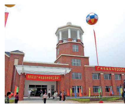
▲二〇〇四年五月六日，廣州市英東中學在南沙竣工，該校由霍英東基金會策劃出資建造的一所國際化學校。