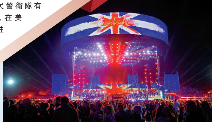
▶英王查爾斯三世的加冕禮音樂會現場。

●拜登計劃從本週開始，額外派出1500名士兵到美墨邊境，協助邊境人員實施移民措施。目前，美國國民警衛隊有2500人在美墨邊境駐守。