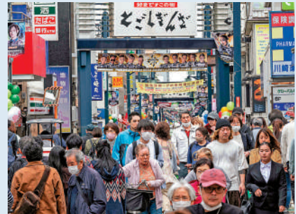
▲日本8日下調新冠病毒防疫等級，與季節性流感同級。

對。日媒報道，東京都將分階段縮小對策，目前會維持面向長者的臨時醫療設施，以保護高風險患者的生命安