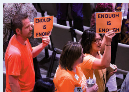
▲得州民眾7日舉着「夠了」的標語，參加商場槍擊案受害者的守夜活動。

據知情人士透露，當局尚未公布作案動機，但槍手胸前的貼片上寫着「RWDS」，為右翼敢死隊的縮寫，