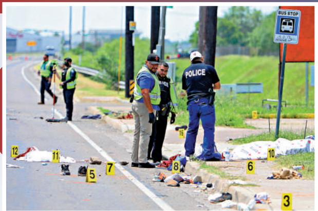
▲得州汽車事故現場遺留受害者衣物，執法人員正在調查。路透社

【大公報訊】綜合CNN、路透社、法新社報道：當地時間8日，美國得州邊境城市布朗斯維爾（Brownsville）發生一起汽車衝撞巴士站候車人群事件，目前造成8人死亡，至少11人受傷。事發地位於該市一個接收非法移民的收容所外，受害者多數是來自委內瑞拉的非法移民。肇事司機已被捕，警方初步認為事故可能是蓄意衝撞。