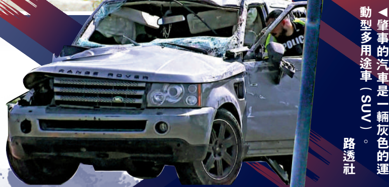
▲肇事的汽車是一輛灰色的運動型多用途車（SUV）。

●2022財政年度，約有240萬非法移民經美墨邊境進入美國，其中有些人多次嘗試越界，較前一年增加24%，成為有紀錄以來的新高。