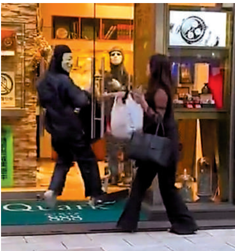
▲路人女子鎮定上前關門。

5月4日，「日本財團」發布一項調查結果，顯示至少半數日本年輕人有自殺念頭。在接受調查的14555名18至29歲的人群中，44.8%有過自殺念頭，其中約40%自殺未遂或進行過自殺準備。據日本厚生勞動省稱，2019年、2020年和2021年，日本年輕人死亡的主要原因均為自殺。