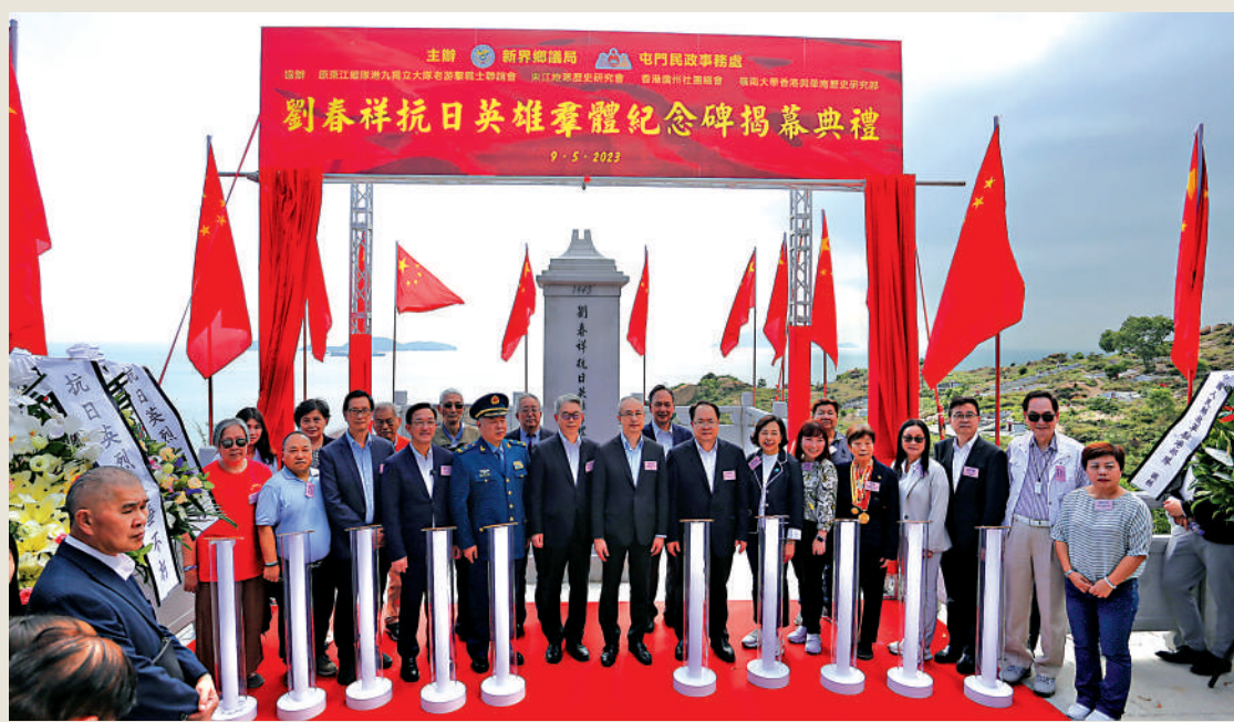
▲劉春祥抗日英雄群體紀念碑揭幕典禮在香港屯門龍鼓灘隆重舉行。

「劉春祥抗日英雄群體的英雄事跡是中國共產黨領導香港抗戰的一個歷史片段。劉春祥烈士等面對強敵寧死不屈的鬥爭精神是中華民族寶貴的精神財富，是在香港進行