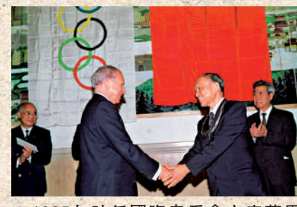
▲1995年時任國際奧委會主席薩馬蘭奇向霍英東頒授奧林匹克勳章。