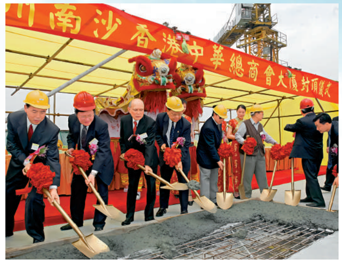
▲霍英東（左三）致力發展南沙，圖為二〇〇四年，他與時任中華總商會會長曾憲梓、時任廣州市市長張廣寧等為廣州南沙香港中華總商會大廈舉行封頂儀式。

1980年12月28日，中山溫泉賓館舉行了隆重的開業典禮。霍英東在講話中特別強調：「誰講中國的改革開放不行，請你看中山溫泉賓館。你們不信祖國的改革開放會成功，我信！」