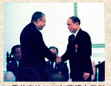
▲霍英東於1997年獲頒大紫荊勳章。