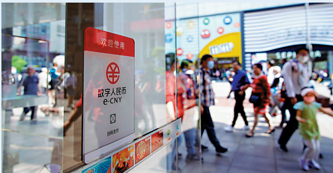
▲中國對數字人民幣（e-CNY）的探索走在世界前列，具有國際領先優勢。

有名牌屋苑，又有名牌身份，地產代理當然也有「名牌」，當你以往能夠做到一些大金額或創新高價的成交，就可以向買賣雙方顯示你的能力，漸成為代理中的「名牌」，買家對你的信任程度亦會增加。