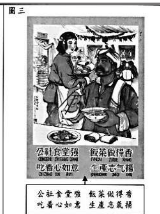
圖三：八字憲法執行好。公社食堂強 飯菜做得香 吃著心如意 生產志氣揚。

朝的政治架構及清初民族管制、甲午戰爭、維新變法、抗日戰爭，並需援引史實說明國民黨在國共內戰戰敗的原因，及文化大革命和改革開放等。