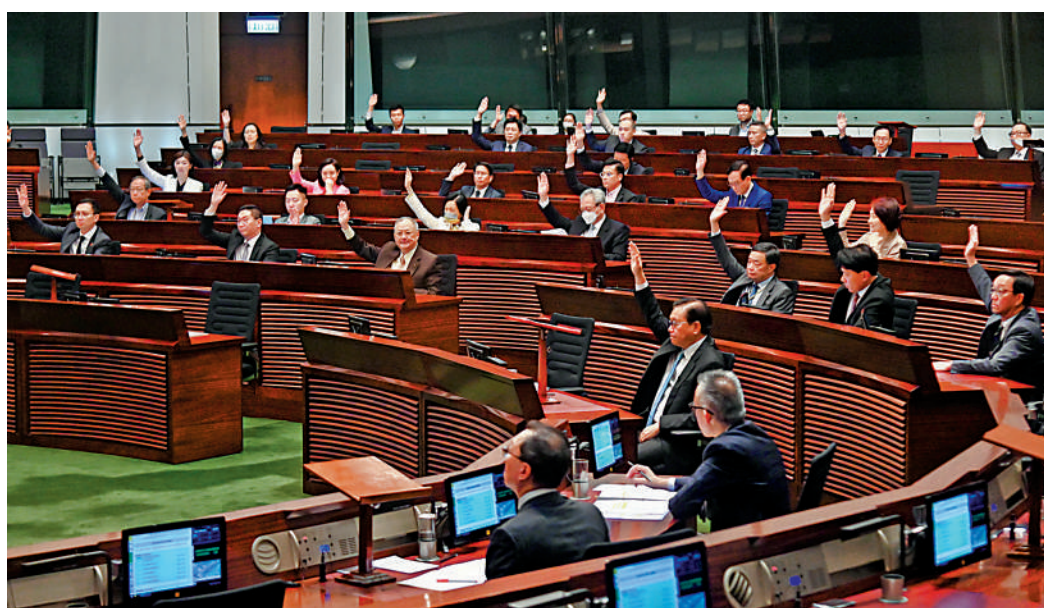
▲立法會昨日三讀通過《2023年法律執業者（修訂）條例草案》。

條例草案規定設兩階段機制。第一階段是甄別程序，海外律師就國安案件向原訟法庭提出專案認許申請前，必須先獲行政長官發出「准許進行申請通知書」。在第二階段，法院必須向行政長官提出並取得由行政長官發出的證明書，以認定該申請是否屬於