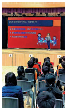
▲培僑書院小學部獲優質教育基金資助，與外界服務供應商合作，讓學生運用動畫軟件製作一分鐘動畫，學校同時提供講座及工作坊。