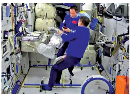
▲神舟十五號乘組在空間站堅守崗位，準備迎接天舟六號。

此次天舟六號攜帶3名航天员280天的生活物資，上行補加推進劑700公斤，運輸物資總重約5800公斤。物資主要包括服裝、食品、飲用水等，其中新鮮水果重約70公斤。據介紹，未來將上行一個大冰櫃，不僅可以儲存水果，還有冷凍食品，航天员可以在天上吃煎牛排。