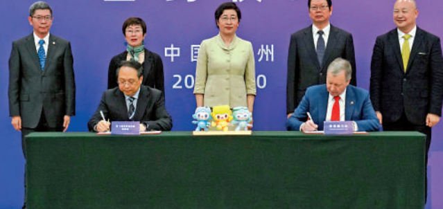
馬會提供技術支援一覽