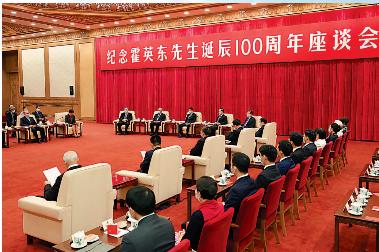
▲5月10日，紀念霍英東先生誕辰100周年座談會在北京舉行。

【大公報訊】據新華社報道，紀念霍英東先生誕辰100周年座談會10日在京舉行。中共中央政治局常委、全國政協主席王滬寧出席座談會，並在會前會見了霍英東先生親屬。中共中央政治局委員、中央統戰部部長石泰峰在座談會上緬懷了霍英東先生的光輝一生。