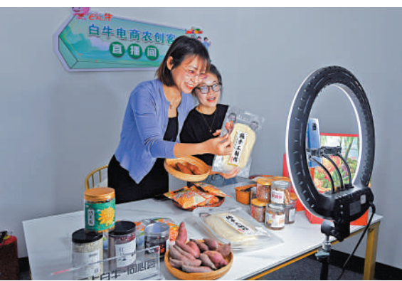
▲新業態發展創造新就業機會。圖為杭州返鄉創業人才通過直播助農增收。