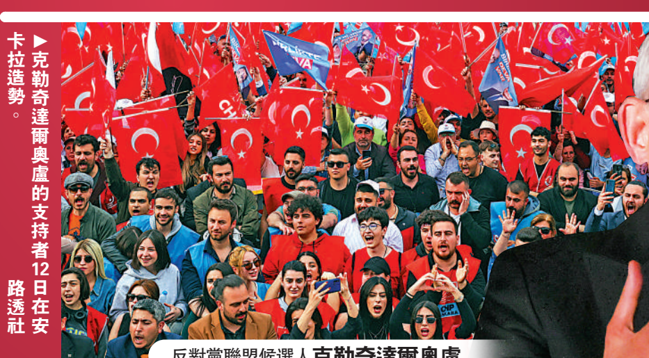
反對黨聯盟候選人克勒奇達爾奧盧