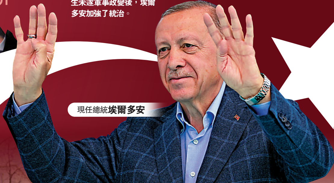
現任總統埃爾多安