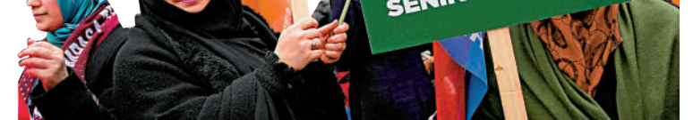
埃爾多安的支持者12日在伊斯坦布爾集會。

不過，大選相關的技術和安全工作已完成。無論因傑是否參選，他的名字已經出现在了選票上，民眾仍可投票給他，這些支持因傑的選票也將進一步促使總統大選進入