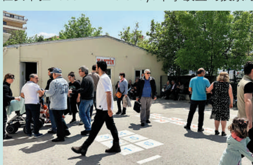
土耳其選民14日在票站門前聚集。

點，很多選民以家庭為單位前往站點投票。該中學將其一座三層教學樓設置為投票點，共有15個投票室。選民憑選票信息卡進入投票室內，分別獲取有關總統和議會選舉的兩張選票。如果總統大選存在第二輪，選民依然需要出示該信息卡在第二輪中投票。