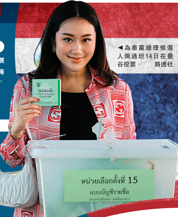
為泰黨總理候選人佩通坦14日在曼谷投票。